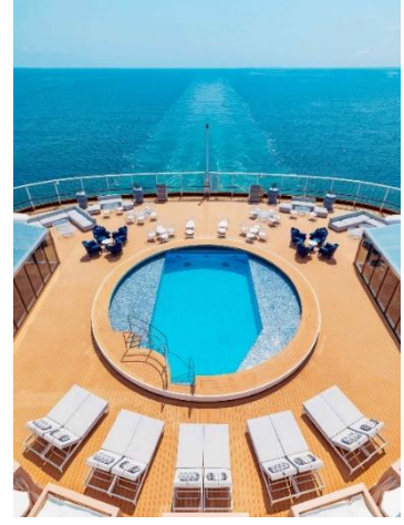
بركة السباحة الشخصية في جناح القصر على متن ريزورتس وورلد ون

يمكن للزوار المسلمين الاستمتاع بالرحلة بطمأنينة مع توفر خيارات الطعام الحلال. يتوفر 18 مطعم على متن الباخرة بخيارات تتراوح بين المطبخ الآسيوي والعربي والشامي، وتتوفر أيضاً "الشيشة" في بعض المطاعم. كما توجد بركة سباحة بطابع روماني وبركة الجاكوزي والعروض الحية والحفلات والألعاب الافتراضية ومختلف الأنشطة، فضلاً عن التسوق المعفى من الرسوم الجمركية والمنتجات الصحية المريحة وورش العمل الإثرائية والأفلام وغيرها.