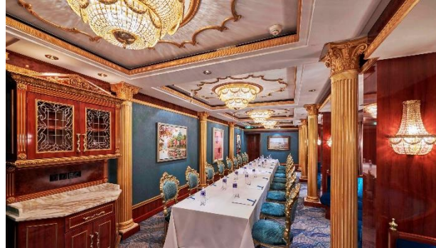
The Vintage Room on Resorts World One.

Besides these amazing destinations, vacationers can sit back and relax to enjoy the finest offerings of the Resorts World One - 'A Resort Cruising at Sea'. Start by choosing your choice of onboard accommodations, from Interior Staterooms to Oceanview, Balcony staterooms and the luxury suites, "The Palace" – 'a luxury ship-within-a ship' private all-suite enclave with exclusive restaurant and 24-hour butler service.