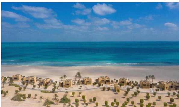
The stunning Sir Bani Yas Island in Abu Dhabi.

Muslim cruise passengers will be an important market segment and in order to cater for them, the Resorts World One will receive the official OIC/SMIIC* Standard Halal-Friendly Cruise Ship certification, providing regional Muslim travellers with the convenience and access to certified Halal-Friendly offerings onboard the ship. All meats are sourced from UAE Halal suppliers with no pork served onboard. In addition, guests can make pre-advanced appointments to have the crew of the same gender attend to the guests for selected onboard services such as the Spa. Certified Vegetarian and Jain cuisine will also be available to cater to travellers from India and others who prefer specialized vegetarian selections. Besides that, onboard public announcements will be made in both the English and Arabic languages.