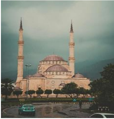
The beautiful Said bin Taimur Mosque in Muscat, Oman.