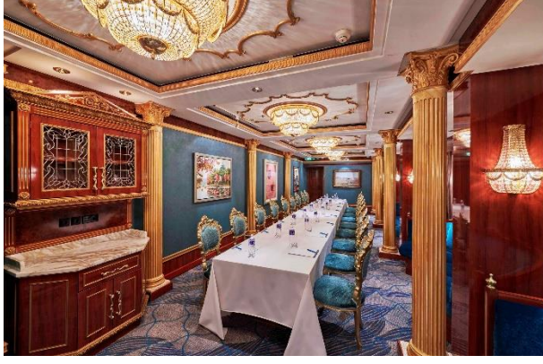
الغرفة الكلاسيكية على متن ريزورتس وورلد ون

بالإضافة إلى هذه الوجهات الرائعة، يمكن للمسافرين الاستجمام والاستمتاع بأفخم المزايا على متن باخرة ريزورتس وورلد ون، "منتجع يطفوا فوق الأمواج". تبدأ رحلتك عندما تختار غرفتك من بين عدة خيارات مثل الغرفة الداخلية أو المظلة على المحيط أو الغرفة مع شرفة، أو إحدى الأجنحة الفاخرة مثل "القصر" - باخرة فاخرة على متن باخرة- وهو جناح خاص بمطعمه الحصري و خادم شخصي على مدار الساعة.