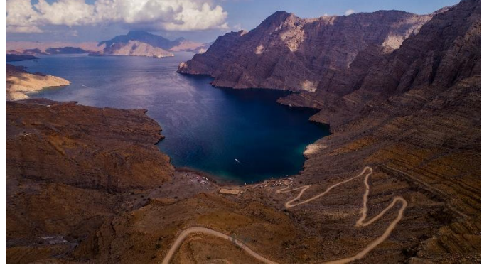
اكتشف مياه خصب الزرقاء والحياة البحرية

تلقّب خصب عادةً بـ "النرويج العربية" لما للتميز به من تضاريس جبلية محاطة بالمياه والمضائق البحرية والجبال النائية التي تشبه تلك الموجودة في النرويج. تمتلك خصب معالم تاريخية وتراثاً غنياً. كما تحتوي على جبل حريم الذي يوفّر مناظر بانورامية لا مثيل لها والعديد من المغامرات الممتعة. ناهيك عن الشواطئ المميزة والمياه الرائعة التي يعيش فيها مختلف الكائنات البحرية والشعاب المرجانية.