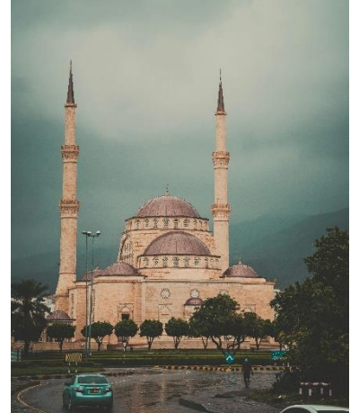
مسجد السيد طارق بن تيمور في مسقط، عمان.

أما بالنسبة إلى الرحلة البحرية إلى عمان والتي تستمر لمدة 3 ليالي ، فهي تمر بجواهر السلطنة: مسقط وخصب. تتميز هذه المدن بمناظر أخاذة من الجبال والمحيط. تنفرد مسقط بالعديد من المواقع التاريخية المحاطة بالجبال البركانية، والشواطئ الذهبية، والمياه الزرقاء. كما تحتوي العاصمة على بعض القلاع القديمة والمتاحف وأحد القصور التي بنيت على حافة تطل على البحر، وبتصاميم هندسية مستوحاة من مختلف الحضارات ومنها العربية والفارسية والهندية والبرتغالية.