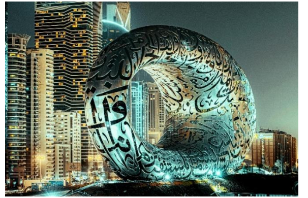
تجربة غامرة للفن في آرتي ميوزيوم دبي

يمكن للرحالة من دوحة إلى دبي اكتشاف الوجهة الأكثر شعبيةً عالمياً بحسب موقع Tripadvisor لمدة 3 أعوام متتالية. اكتشف شواطئها الجميلة ومعالمها المحظمة للأرقام القياسية ومختلف المغامرات الممتعة والتجارب الفريدة. وذلك يشمل أول منتزه خاص بكرة القدم: عالم ريال مدريد في دبي باركس آند ريزورتس الذي يقدم أكثر من 40 تجربة وفعالية ومنها لعبة طائرة النجوم "ستارز فلاير" وهي الأعلى من نوعها في العالم بارتفاع 460 قدماً. إضافةً إلى ذلك، يمكن زيارة إحدى أحدث الوجهات في دبي التي تقدم تجربة غامرة للفن، وهو آرتي ميوزيوم دبي، والذي يقدم لزواره تجارب لا مثيل لها باستعمال أحدث التقنيات المتطورة. وللمزيد من المتعة تحت الشمس، توجه إلى شاطئ جزر دبي، وهو من أحدث الوجهات لمحبي السفر والعائلات بفضل جماله والأنشطة المائية التي يقدمها. كل هذا والمزيد ينتظرك في دبي.