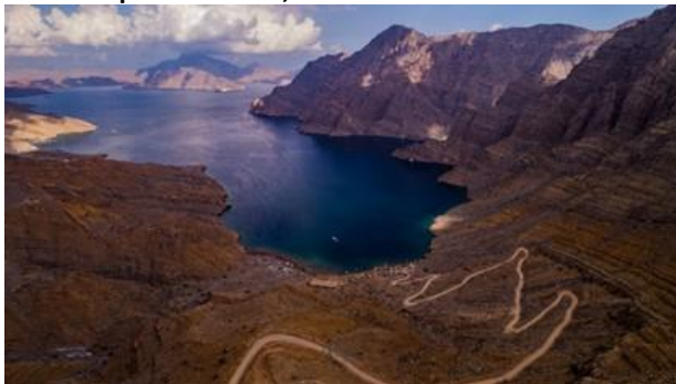
Discover Khasab's clear turquoise waters and underwater sea life.

For the 3 Night Oman Cruise , both Muscat and Khasab are Oman's gem cities that offer amazing scenic mountains and beautiful oceans. As the largest and capital city of Oman, Muscat is filled with unique historical wonders surrounded by volcanic mountains, sandy beaches and beautiful lagoons. Muscat is also home to old forts, amazing museums, a palace built at the edge of the sea and unique architectures that draw influences from different cultures like Arab, Persian, Indian and Portuguese.