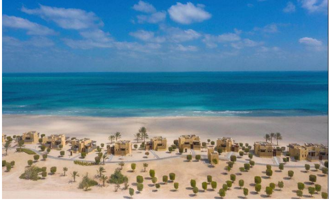
جزيرة صير بني ياس الخلابة في أبو ظبي

انضم لمغامرة مثيرة واكتشف الحياة البرية المتنوعة أو استرخ على العديد من الشواطئ الجميلة في الجزيرة. تتوفر الحفلات على الشاطئ وعلى متن الباخرة خلال هذه الرحلة.