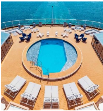
Resorts World One's exclusive Palace Pool deck.

With all Halal-friendly onboard food offerings, Muslim guests can enjoy the cruise vacation with peace of mind. Discover across the 18 onboard restaurants international and authentic Asian cuisines, including Arabic and Levantine choices; enjoy a hookah with your choice of shisha at selected outdoor venues; a Roman themed Parthenon Pool with a Caesar's Slide and Jacuzzis, LIVE international stage shows, parties and entertainment, fun virtual games and recreational activities; onboard duty-free shopping with a wide selection of brands and products; rejuvenating spas; enrichment workshops; movie nights at sea and more.