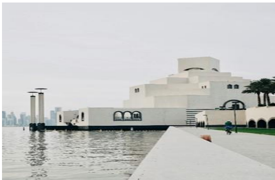
The Museum of Islamic Art, a popular attraction in Doha.

Khasab is often dubbed the "Norway of Arabia" due to its fjord-like craggy inlets and desolate mountain landscapes, reminiscent of the scenic fjords of Norway. The city is filled with centuries of rich history and heritage; and is also home to Jebel Harim or the 'Mountain of Women' that offer a one-of-a-kind breathtaking panoramic view and trekking adventure. Amazing beaches with turquoise waters are part of Khasab's charm, perfect for snorkelling, showcasing an abundance of underwater sea life and corals.