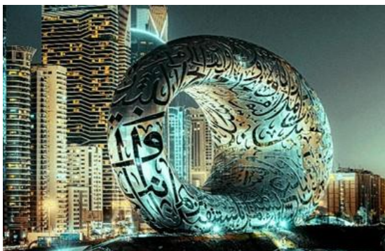
An immersive art experience at ARTE

For the Wednesday departures from Dubai, vacationers can explore the enchanting city of Doha with the 2 Night Doha Cruise . Doha is famous for hosting the 2022 FIFA World Cup and is one of the Middle East's top destinations, where old-meets-new in many forms, a melting pot of cultures and nationalities that is reflected in its landmarks, arts and architectures. Discover a wide variety of mouth-watering cuisines and food festivals to adventurous activities, dune bashing, camel races and more.