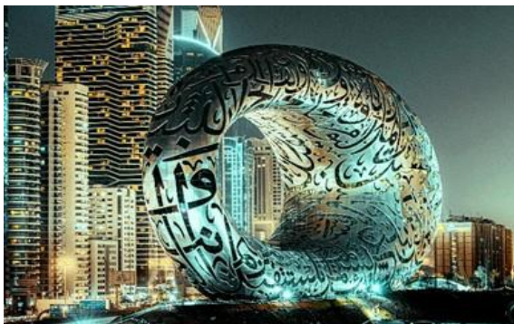
沉浸式體驗杜拜藝術博物館的藝術。

週三從杜拜出發的旅客還可以選擇 2 晚多哈航次以探索迷人的多哈。多哈因舉辦 2022 年 FIFA 世界盃而聞名，是中東的頂級旅遊目的地之一，融合了新舊文化，是文化和民族的熔爐並體現在其地標、藝術和建築中。探索各種令人垂涎欲滴的美饌和美食節，以及冒險活動、衝沙、騎駱駝等。