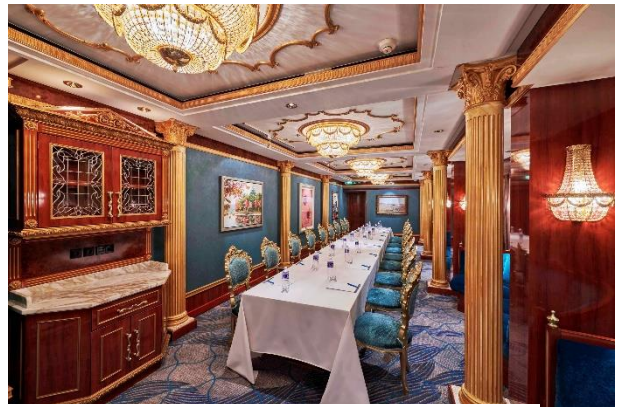
名勝世界壹號上的星宴餐廳。

同時，旅客可以享受作為「海上度假郵輪」的【名勝世界壹號】的優質服務。多款舒適休閒的船上住宿包括內側客房、海景客房、露台客房和獨特的「船中船」概念—「The Palace 皇宮」豪華套房，配有全天候 24 小時歐式管家禮賓服務、專屬餐廳、日光浴平台、健身房等設施，供旅客選擇。