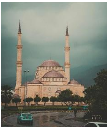
阿曼馬斯喀特美麗的賽義德·本·泰穆爾清真寺。

週五從杜拜出發的旅客可以享受 2 晚薩巴尼亞島週末航次 。在這個世界著名的島嶼上有 17,000 多種動物，包括阿拉伯大羚羊、駝鳥、瞪羚、鹿、長頸鹿。來踏上這興奮冒險之旅，發現各種野生動物，或在島上美麗的海灘上放鬆身心。在此週末航次，海灘和船上都會舉辦派對。