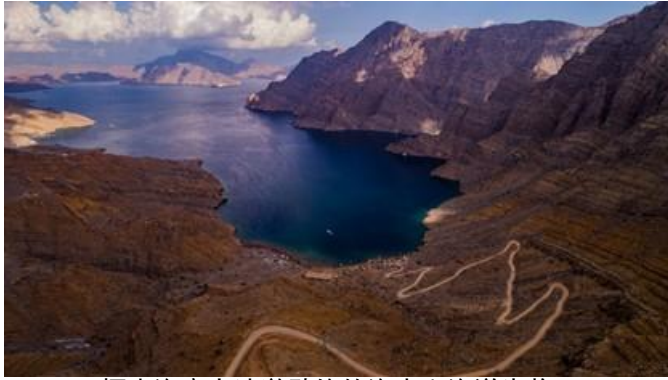
探索海塞卜清澈碧綠的海水和海洋生物。

海塞卜因其峽灣般崎嶇的入口和荒涼的山地景觀而常被稱為“阿拉伯的挪威”，讓人想起挪威風景秀麗的峽灣。這座城市擁有數百年的豐富歷史和遺產；這裡也是傑貝爾哈里姆山(Jebel Harim)或「女人山」的所在地，提供獨一無二的令人驚嘆的全景觀和健行冒險。迷人的海灘和碧綠的海水是海塞卜魅力的一部分，非常適合浮潛及展示豐富的海洋生物和珊瑚。