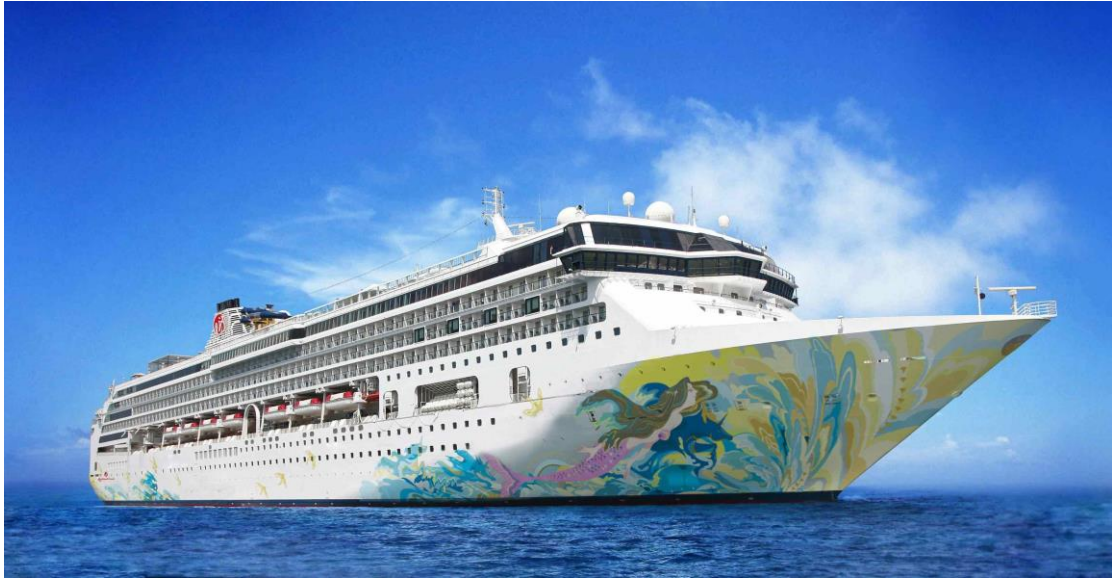
名勝世界郵輪【名勝世界壹號】將擴大足跡至阿拉伯灣及阿曼灣。