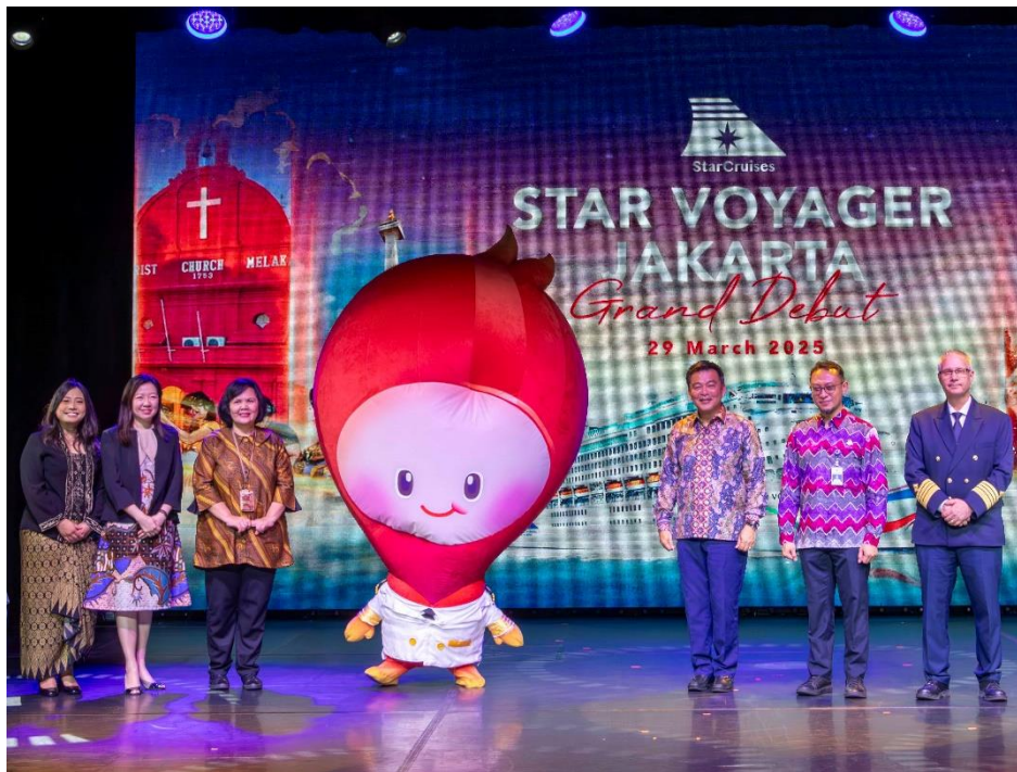
29 March: Celebrating the launch of the revitalized StarCruises and Dream Cruises brands in Jakarta with the maiden voyage of the Star Voyager from Tanjung Priok.

29 March 2025 (Jakarta, Indonesia) – StarCruises , the revitalized successor to the legendary Star Cruises brand, alongside the iconic Dream Cruises , continued their launch celebrations in Jakarta today, further strengthening their presence in the region. This marks an exciting new chapter for both brands, building on 30 years of rich heritage and a strong cruising legacy, particularly in Asia. The event also coincided with the maiden arrival and inaugural sailing of the Star Voyager cruise ship in Jakarta, which had undergone a US$50 million refit, adding to the excitement of the celebration.