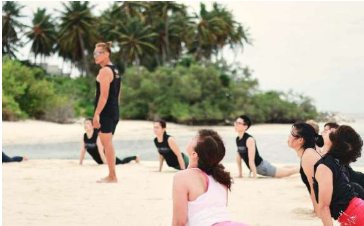
訓練、航行、放鬆，一次盡享！加入麗星郵輪聯乘 Under Armour，於2026年1月19日至23日從巴生港出發，登上【領航星號】參與「Fitness @ Sea」海上健身體驗。

2026年1月19日至23日：一趟4晚的活力生活方式郵輪之旅，融合健身運動、身心放鬆與旅遊體驗，從巴生港啟航，前往普吉島及新加坡。